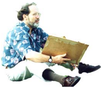
HJÄRTAT HANDEN HJÄRNAN

Vi har samtal om konst och bilder från "modellskolor" och börjar såsom nyfikna barn och konstnärer med öppna problemformuleringar: experimentellt, subjektivt och processinriktat, växlar fokus mellan detalj och helhet. Vi lånar identiteter. Arbetet drivs framåt av lust. Vi iscensätter detta tematiska och gränsöverskridande sätt att analysera, argumentera och reflektera.